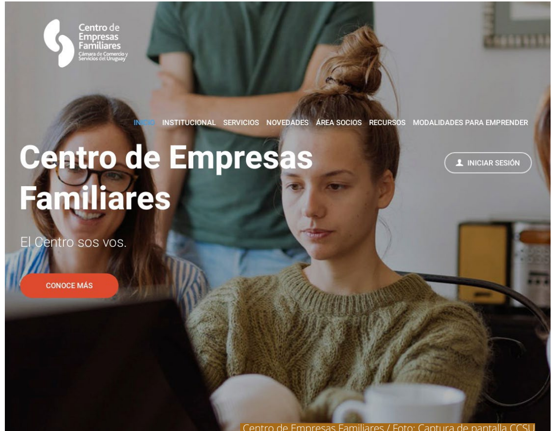
Centro de Empresas Familiares

El sector automotriz tiene un acuerdo con el Mercosur