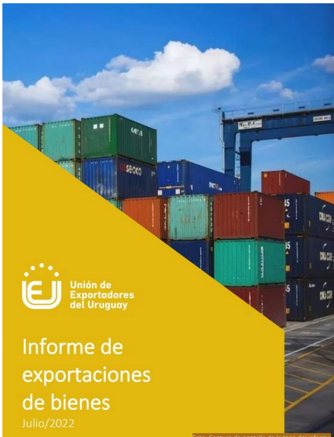
Foto: Captura de pantalla de la tapa del informe

Si se miden las solicitudes de exportaciones de bien en toneladas, éstas aumentaron en julio un 14,15 por ciento frente a igual mes del año pasado. Esto significa que el aumento del mes respondió en promedio básicamente a los mejores precios de exportación, ya que el aumento de las colocaciones medidas en dólares fue superior.