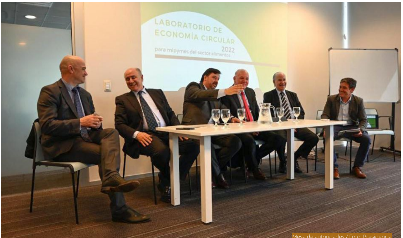
Mesa de autoridades

El pasado 26 de julio en el edificio Anexo de Torre Ejecutiva se llevó a cabo el lanzamiento de LABEC 2 por parte del Ministerio de Industria, Energía y Minería (MIEM) y otras instituciones. Éste tiene por objetivo capacitar a las mipymes alimenticias y apoyarlas en iniciativas concretas.