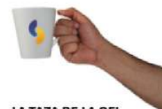
LA TAZA DE LA OFI