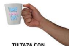
TU TAZA CON FRASES MOTIVACIONALES