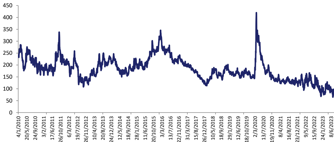
Riesgo País (2010–2023)